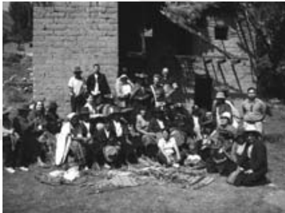
El grupo entero del encuentro visitando el taller de mujeres de Chari, Checacupe

Se han reunido en Cuzco, Perú, del 11 al 22 de Mayo, 22 participantes de talleres de las Siervas de San José y representantes de "Taller de Solidaridad" CON EL PROPÓSITO DE PONER LAS BASES PARA UN TRABAJO PARTICIPATIVO ENTRE LOS TALLERES de Siervas de San José, Y TALLER DE SOLIDARIDAD de cara a la producción y comercialización en España de sus productos a través del Comercio Justo.