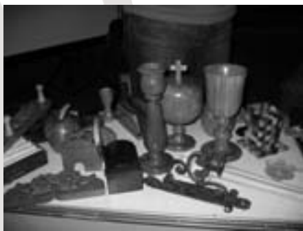
Productos de los Talleres de San Juan de Luz, de Colombia

Así Taller de Solidaridad convocó a Siervas de San José y laicos que participan en los Talleres a encontrarnos unos días, y elegimos un lugar donde había varias experiencias ricas en este aspecto, Cuzco. Además hemos contado con la ayuda de la ONG exportadora de comercio justo de Perú, MINKA , que nos ha apoyado en algunas de las actividades y contenidos del encuentro.