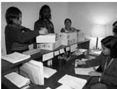
Entrega de firmas de la campaña en las Cortes por representantes de los cinco continentes

La campaña Sin duda, sin deuda" entra en su recta final. Ha sido una campaña en la que hemos participado apoyándola desde REDES.